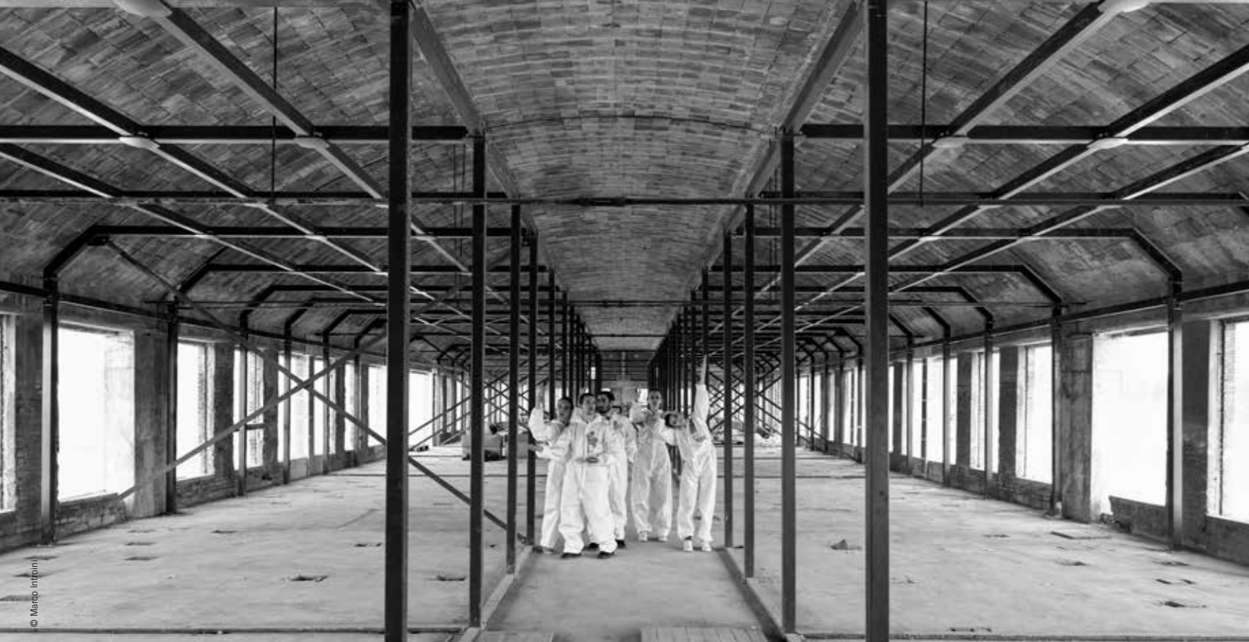
MANTOVA HUB: Piazza del Pensiero Istituto Scolastico A. Mantegna nella ex Ceramica / A. Mantegna School Institute in the former Ceramica